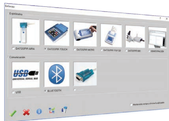
Compatible con todos los espirómetros Sibelmed